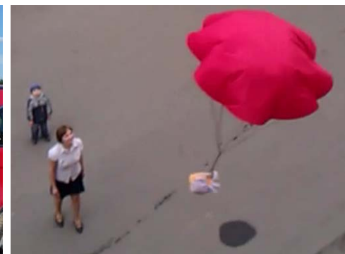
Тестирование парашютной системы