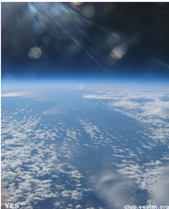
Фотография из стратосферы с высоты около 30 000 м