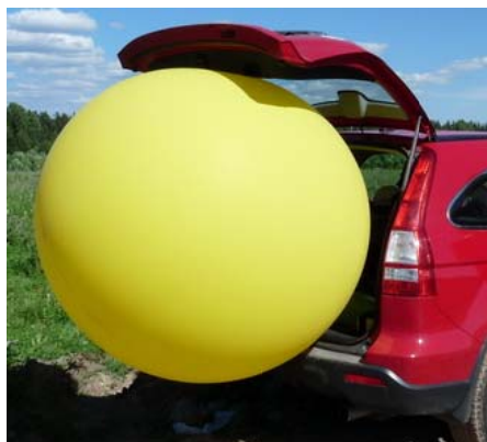
Заполнение шара гелием