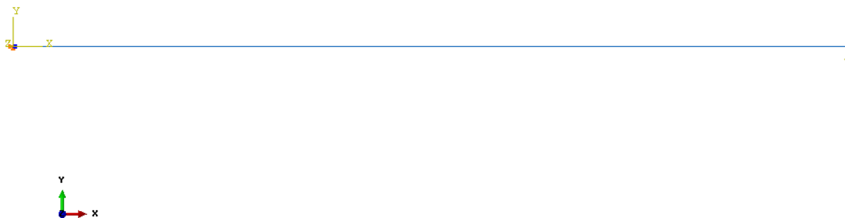
Рис. 3 Эскиз

Данная задача является динамической трехмерной задачей. Задача решается методом конечных элементов. Строится сетка, размер элемента которой равен 0.01 м. Сетка линейная, имеет тип B21. У каждого узла есть 2 перемещения и поворот вокруг оси, перпендикулярной этим двум. Ниже приведен эскиз балки. (Рис. 5) На правый конец балки через каждые T_0 с. перпендикулярно действует сила, равная F . Для создания такой силы был применен метод равномерного расположения. Время, за которое производились расчеты равно 1с. Шаг разбиения по времени равен 0.002 с.