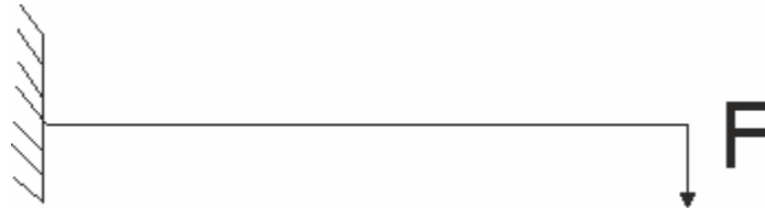
Рис. 1. Балка

Имеется балка, один конец которой – заделка. На правый конец балки периодически действует сила. Период равен T_0 . Сечение имеет вид прямоугольника. Требуется численно найти прогиб самой правой точки балки в зависимости от времени. На рисунке 1 показана балка, а на рисунке 2 профиль балки. Ниже приведены значения силы ( F ), модуля Юнга ( E ), коэффициента Пуассона ( \nu ), геометрические параметры балки ( a , b ). T_0 – период, соответствующий первой собственной частоте балки.